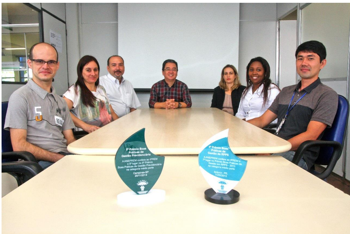
Equipe do IPREM – Mogi das Cruzes (SP) responsável pela conquista do 4º (7º Lugar/2013) e 5º (5º Lugar/2014) Prêmio Boas Práticas de Gestão Previdenciária