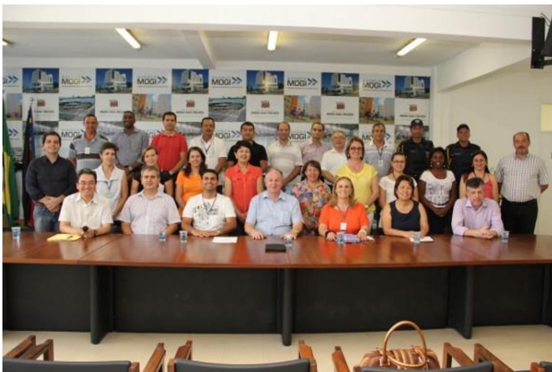
Foto da posse dos novos conselheiros